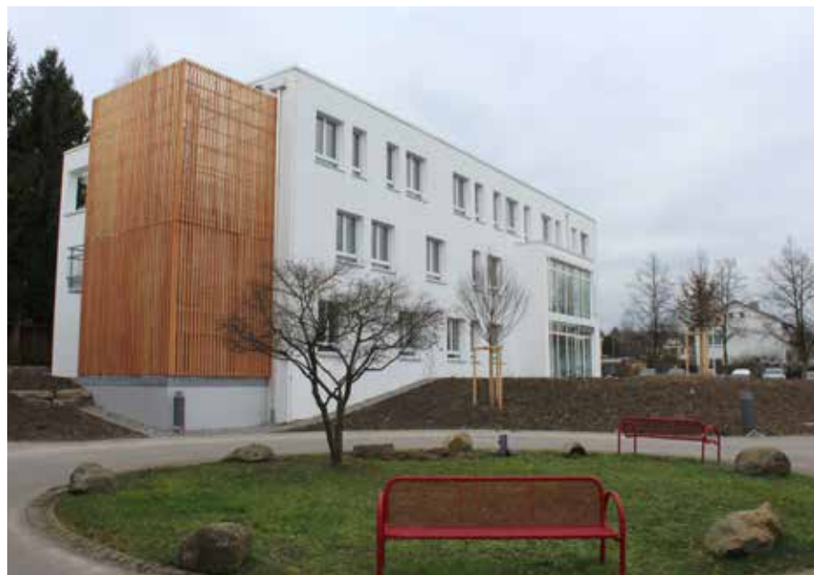
Der Neubau fügt sich harmonisch in das Quartier Galgenhalde und das benachbarte Pflegeheim St. Meinrad ein.