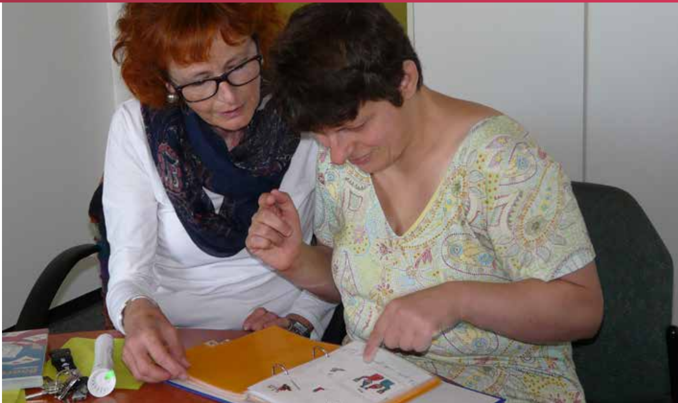
Ein ICH-Buch muss nicht perfekt sein, darf wachsen und sich entwickeln. Es macht nicht nur Arbeit, sondern bringt gemeinsam viel Spaß.