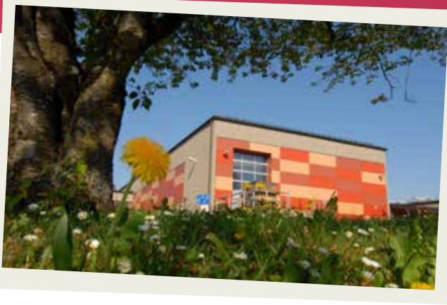
Am Standort Liebenau entstanden die Liebenauer Arbeitswelten. Das neue Werkstattgebäude wurde im Jahr 2006 in Betrieb genommen.

Ausland abgewandert. Die Lücke wurde aber mit anderen anspruchsvollen Aufträgen gefüllt. Ein Novum im AIP: Die Firma Colorus in Amtzell, die den internationalen Markt mit Profi-Malerbedarf bedient, hat ihre gesamte Lagerlogistik inklusive Team ins AIP verlegt und integriert. Zusammen mit Werkstatt-Beschäftigten und Auszubildenden des Berufsbildungswerks Adolf Aich der Stiftung Liebenau kommissionieren sie die geordnete Ware.