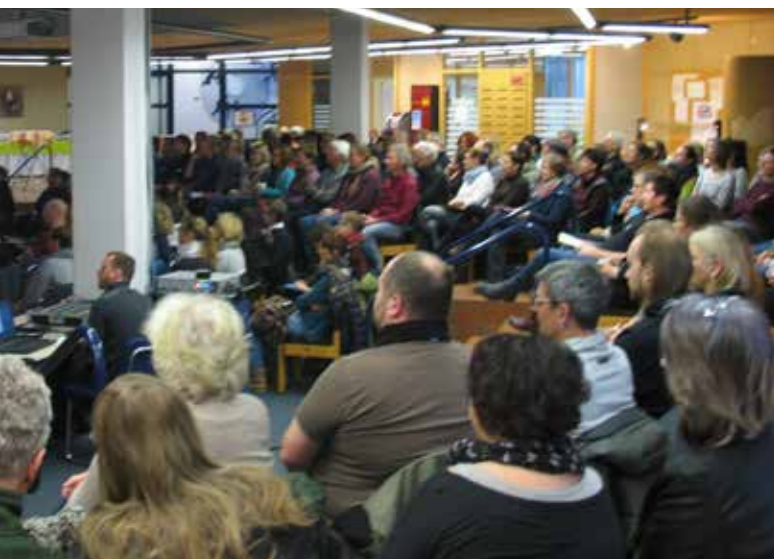
Das Thema des Fachtages „Hilfe – Gewalt“ hat viele interessierte Fachkräfte angezogen.