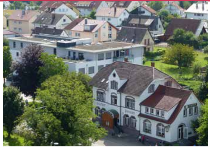
Das neue und moderne Wohnhaus inmitten der Kommune (Bildmitte). Die Bildungs-, Begegnungs- und Förderstätte (BBF) ist unweit entfernt und fußläufig erreichbar.