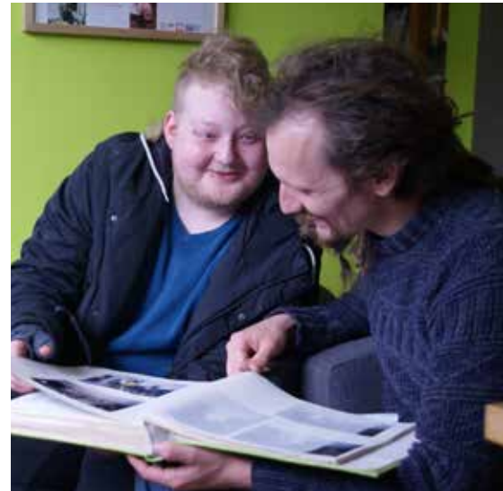
Erinnerungen gemeinsam zu teilen macht Spaß und ist gut für die eigene Identität.

Die Verfügbarkeit von persönlichen Bildern hat sich in den letzten Jahren grundlegend verändert. Heute haben Jugendliche und zunehmend auch ältere Menschen Alltagsfotos hundertfach auf ihren Smartphones bei sich. Alles wird fotografiert: Essen, Schuhe, Landschaften, Freunde und vieles mehr. Auf Instagram und Facebook posten Menschen Tagebücher und Fotostorys, die als Selbstdarstellung und auch als Gesprächsangebot betrachtet werden können. Zugleich besteht die Gefahr des totalen Verlusts der Bilder: Eine defekte Speicherkarte, Virenbefall oder ein Softwarefehler können alle in Sekundenschnelle vernichten. Vielen Jugendlichen ist das oft nicht bewusst. Bei der Flut von Bildern müssen Jugendliche deshalb lernen zu entscheiden, welches Bild eine Erzählung wert ist und mit wem man sich darüber austauschen kann. Das „Bild der Woche“ bietet in Hegenberg Gelegenheit. Jugendliche zeigen ihr Lieblingsbild auf ihrem Smartphone den anderen und erzählen, was ihnen in der Situation wichtig war. So können Bilder für die eigene Identität geschichtsträchtig werden. Um digitale Bilder in die langfristige Biografie einbinden zu